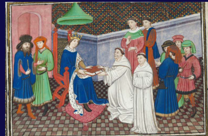
Bruxelles, KBR, ms. 9474, f.1r.

Université de Genève Faculté des Lettres Uni Mail, Salle M1193 Bd du Pont-d'Arve 40 1205 Genève